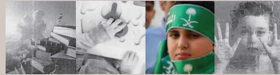
التربية بالحب ..... ص ٦ الاحتفال بذكرى اليوم الوطني ..... ص ٩ أطفالنا والتربية النفسية ..... ص ١٢ ندوات ومحاضرات ..... ص ١٨